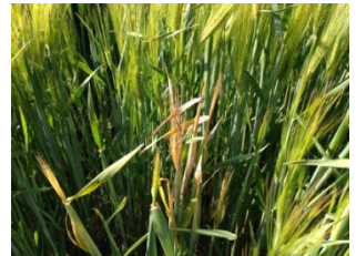
Phénomène d'échaudage sur orge (Juin 2015 – Seine Maritime)