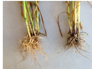
Piétin échaudage sur blé (Gauche : Traité Latitude ; Droite : Témoin non traité) (juin 2014 – Côtes d'Armor)